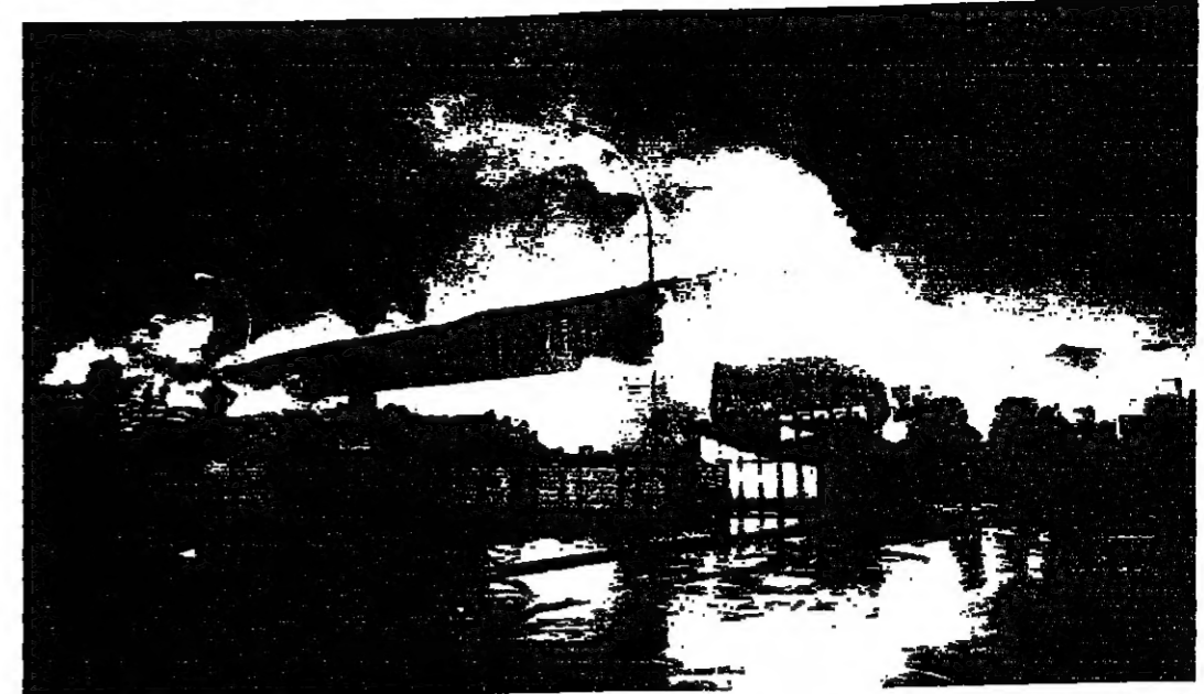
النار تلتهم المستودع رقم ٦ بمساحة امس